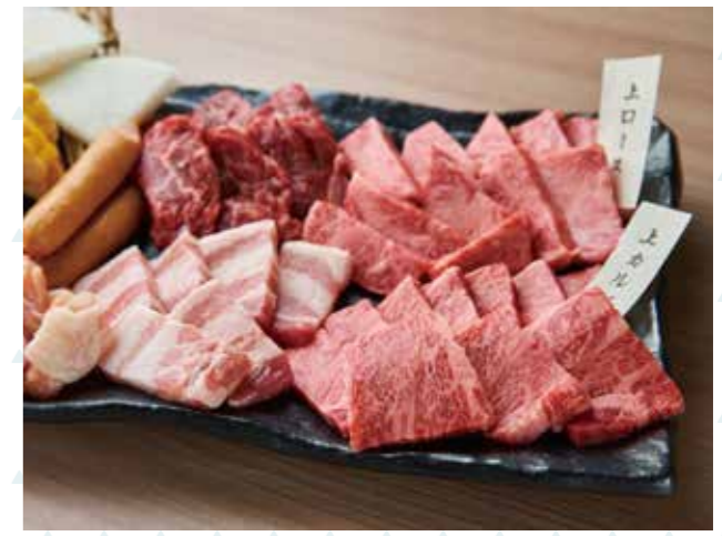
上コース・上カルビ・ハラミなど、6種を盛り合わせたミーツセット4,980円。2~3人でのシェアがおすすめ。