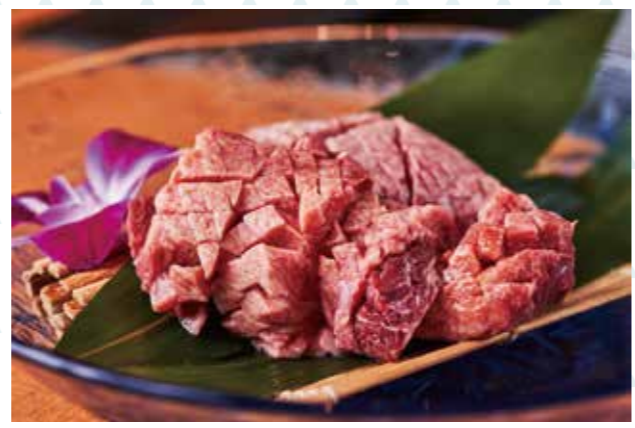
店主のおすすめメニュー、厚切特上タン1,450円。肉厚ながら歯切れがよく、噛むほどに旨味があふれる。

1:希少部位4種(150g)2,980円。岩塩や骨酢でサッパリと食べられる贅沢日替わりメニュー。 2:パーティーのある席でゆったり過ごせる。