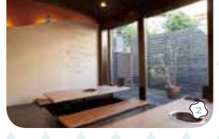
1:歯ごたえが楽しめる白い生セシマイ600円。 2:大きなガラス窓が印象的な掘りごたつ席。