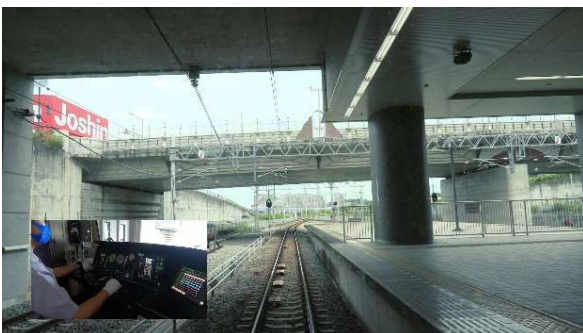
▲「なりきり！運転士」 運転台からの展望動画

◀「光明池車庫オンラインツアー」 画面を360度すべて見ることが できるほか、人型マークをクリック すると移動できます。