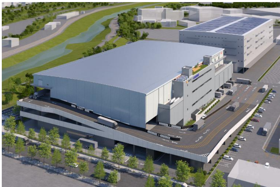
北大阪トラックターミナル新1号棟 外観パース