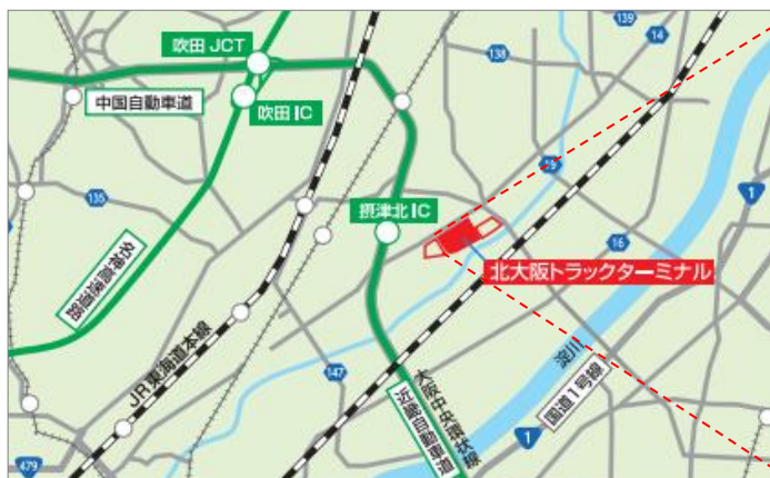
北大阪トラックターミナル位置図