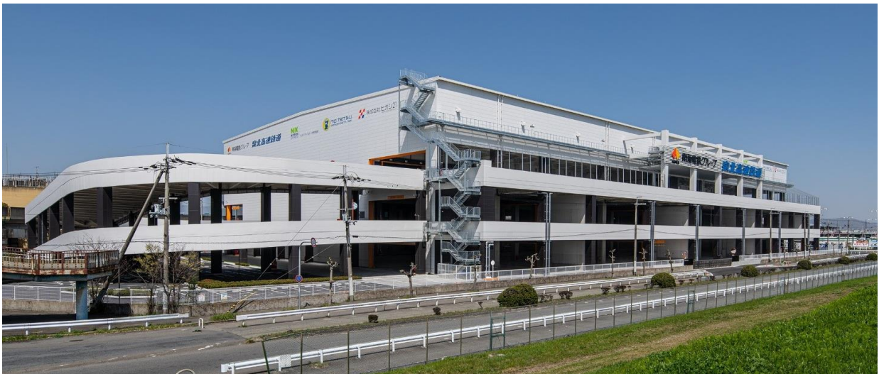
大阪府食品流通センターE棟 外観

また、最大約3日間対応可能な非常用発電機を設置し、災害時でも施設の機能維持を図るとともに、屋上に設置した約300kWの太陽光発電設備により、再生可能エネルギーを活用することができます。