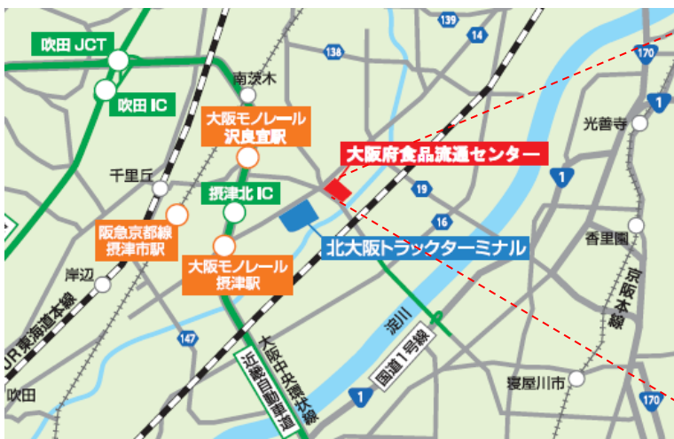
大阪府食品流通センター 位置図