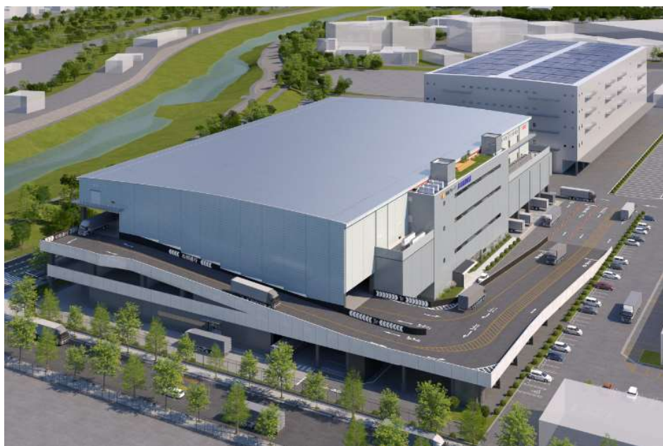
北大阪トラックターミナル1号棟 外観パース