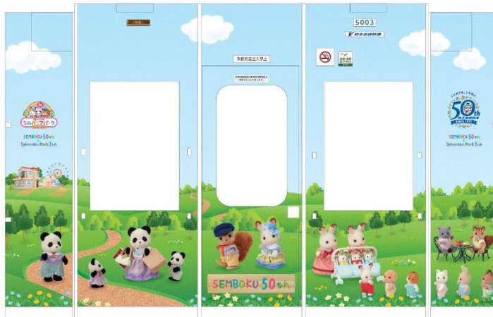
車内運転台壁面デザイン（イメージ）