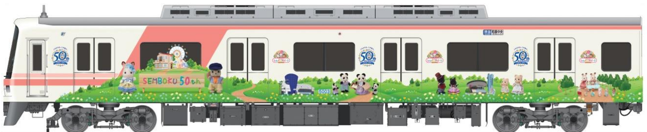
外観デザイン（イメージ）