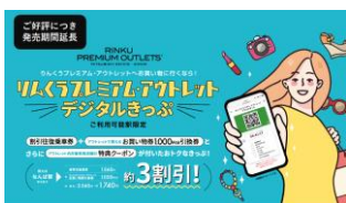
りんくうプレミアム・アウトレットデジタルきっぷ