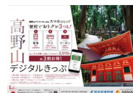
高野山デジタルきっぷ