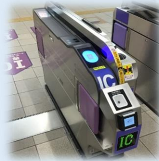
一体型改札機 （泉北高速鉄道）