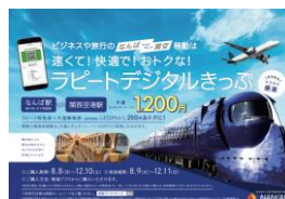
ラビートデジタルきっぷ