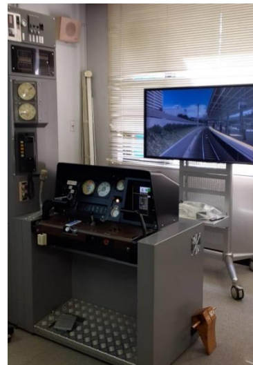
運転シミュレータ