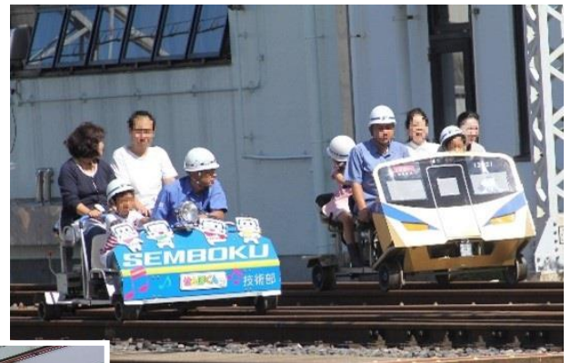
スーパーカート 乗車体験