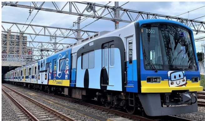
9月8日より運行している 新ラッピング電車

※混雑を避け快適にお過ごしいただくため、事前申込・先着制（入場時間指定）といたします。